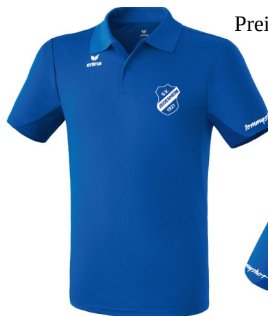
ERIMA Funktions-Polo (Herren S-3XL /Damen 34-48)