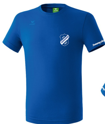
ERIMA Funktions-Shirt (Herren S-3XL /Damen 34-48)

Da zur Zeit keine Veranstaltungen und auch kein Sport möglich ist, machen wir unseren Mitglieder und Fans dieses Angebot zum 100-jährigen Bestehen unseres Vereins